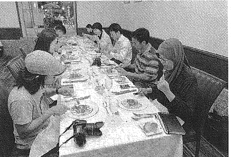
ムスリムフレンドリーメニューを味わうマレーシアなどの一行。横浜市西区の「ブラスリー・ティーズ・ミュージ」

マレーシアの旅行会社の男性は「横浜は成田空港からもさほど遠くなく、今後は箱根などとともにツアーに組み入れたい」。同国の女性週刊誌の女性ライターは「お祈りのできる場所の有無や食事はもちろん重要な要素だが、まずは、その土地に魅力があるかが大事」と話していた。